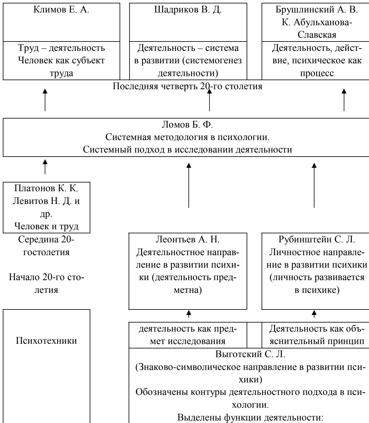
Рис. 2. Основные направления развития деятельностной методологии в психологии