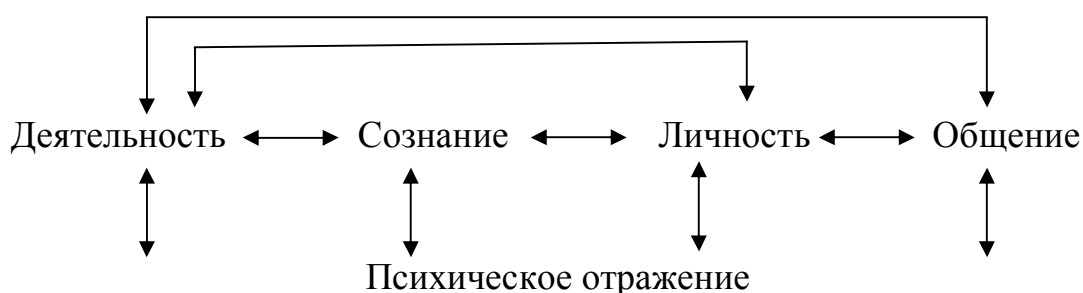
Рис. 1. Базовые категории психологии

Б. Ф. Ломов в качестве базовых категорий психологии рассматривает категории отражения, деятельности, личности и общения (рис. 1) [33].